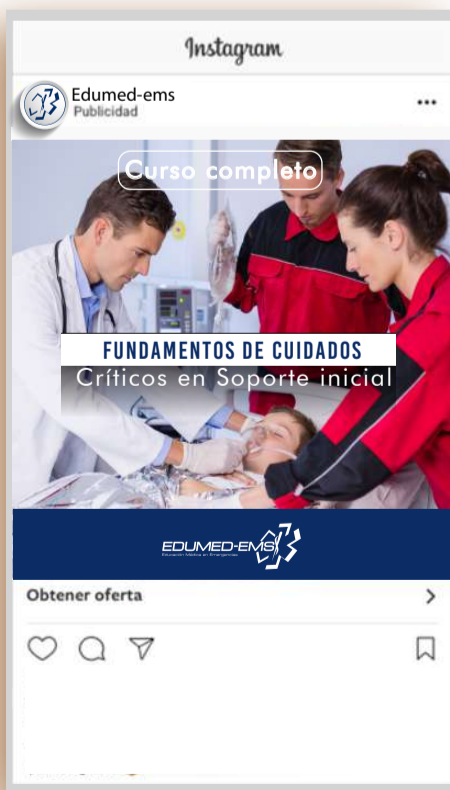
Botón de llamado a la acción