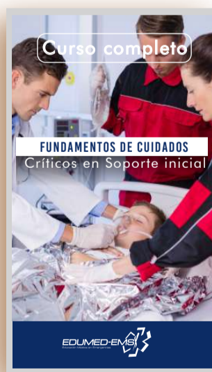
Instagram historys Pauta