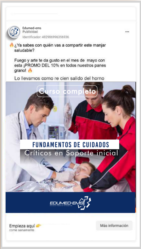
Cuerpo y composición del anuncio en Facebook